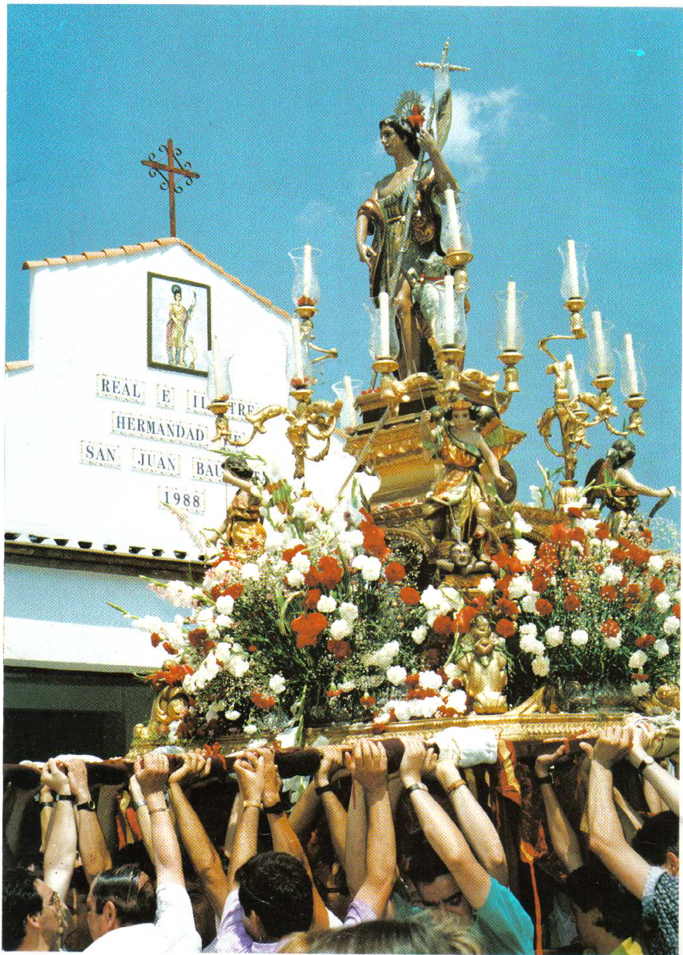
Fiestas Patronales de San Juan Bautista Alosno 1990